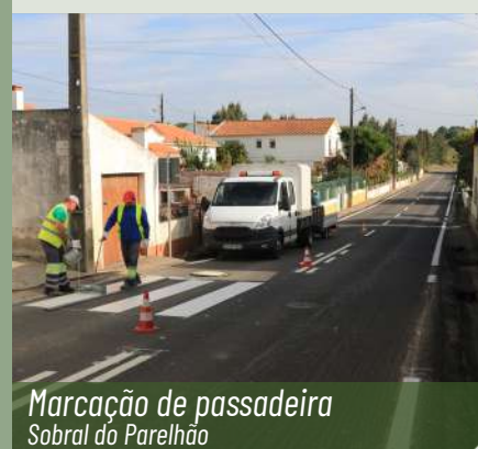
Marcação de passadeira Sobral do Parelhão