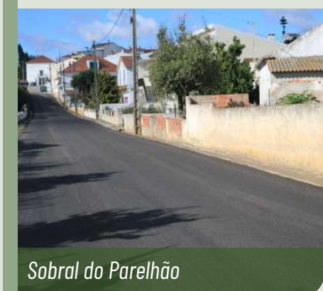
Sobral do Parelhão