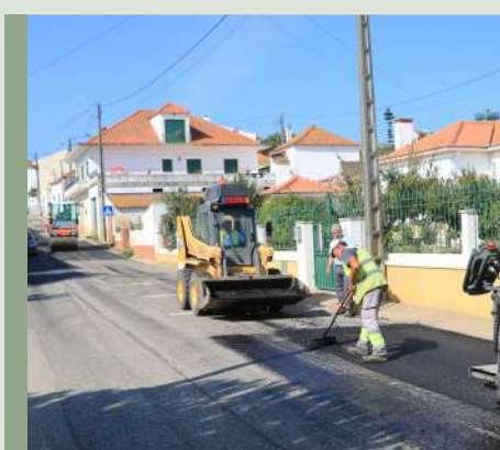
Sobral do Parelhão