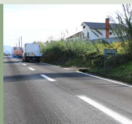
Marcação de estrada Famões